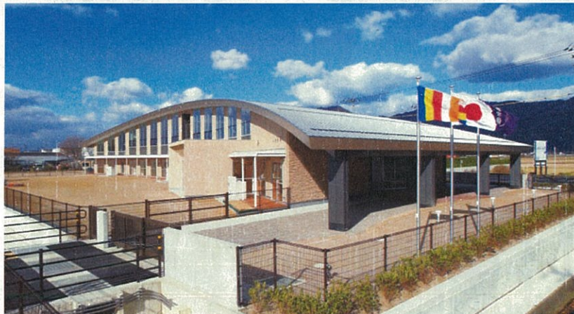
▲グランプリ受賞作品「浜山保育園」(島根県出雲市)

「浜山保育園」は、カーブを描く外壁と大屋根の形状がフロント材を駆使した開口部のデザインとバランスよく調和しています。さらに、それを引き立てる素材と外装仕上げ材の目地の関係性などにより、美しさと格好よさが両立している点が高い評価を得てグランプリ受賞にいたりしました。